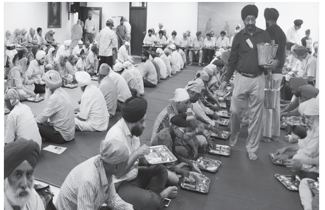
ਪ੍ਰੋਗਰਾਮ ਦੀ ਸਮਾਪਤੀ ਉਪਰੰਤ ਸਦਨ ਦੇ ਕਾਨਫਰੰਸ ਹਾਲ ਵਿਚ ਗੁਰੂ ਕਾ ਅਤੁੱਟ ਲੰਗਰ ਛਕਦੀਆਂ ਸੰਗਤਾਂ।