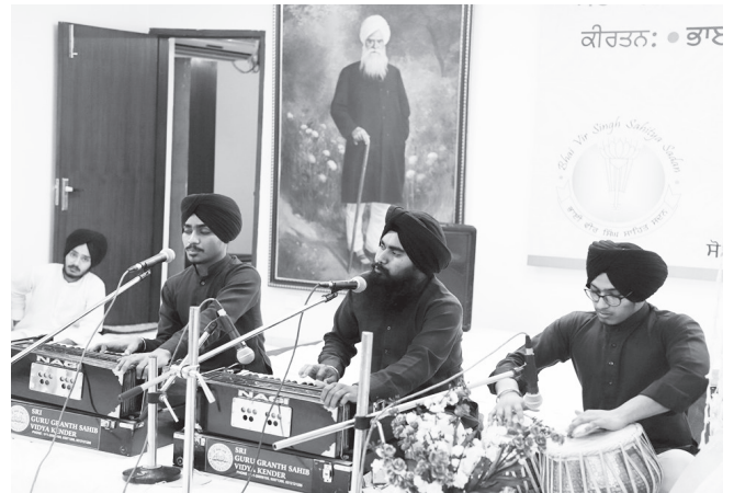
ਗੁਰੂ ਗ੍ਰੰਥ ਸਾਹਿਬ ਦੇ ਸਹਿਜ ਪਾਠ ਦੇ ਭੋਗ ਉਪਰੰਤ ਇਲਾਹੀ ਕੀਰਤਨ ਦੀ ਸੇਵਾ ਨਿਬਾਹੁੰਦੇ ਹੋਏ ਗੁਰੂ ਗ੍ਰੰਥ ਸਾਹਿਬ ਵਿੱਦਿਆ ਕੇਂਦਰ ਦੇ ਵਿਦਿਆਰਥੀ।